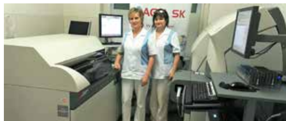
Nemocnica za posledné obdobie obstarala dva moderné analyzátory.

Nemocnica za posledné obdobie obstarala dva moderné analyzátory, ktorými znižuje