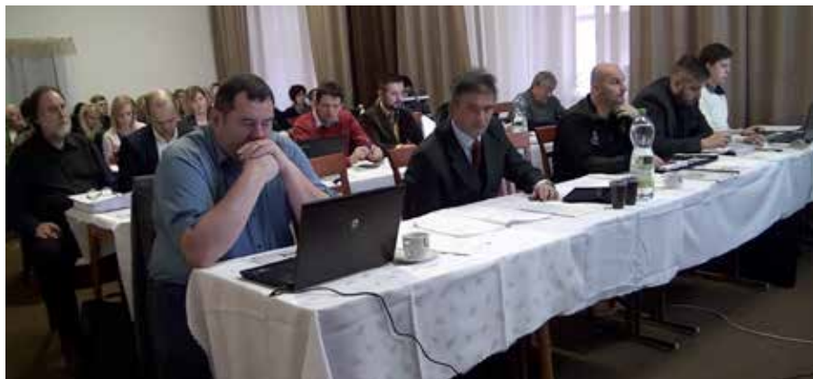
Zlatomoravskí poslanci počas zasadnutia zastupiteľstva.