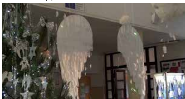
Anjelské krídla z vestibulu školy.