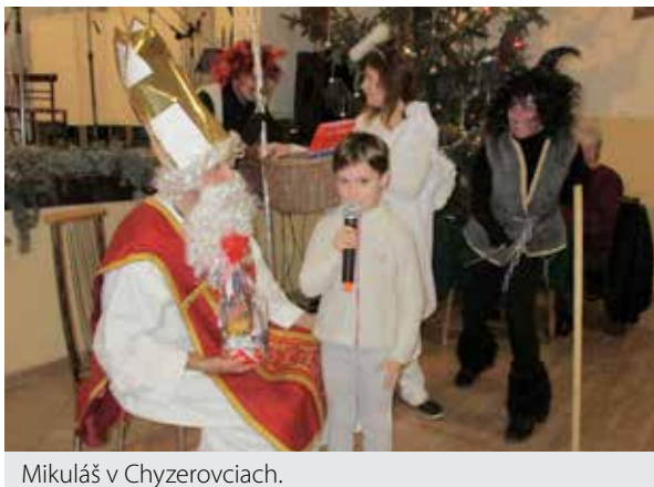
Mikuláš v Chyzerovciach.

Aj mestskú časť Chyzerovce navštívil v predvianočnom čase svätý Mikuláš. V sobotu 9. decembra 2017 sa v miestnom kultúrnom dome uskutočnila Vianočná akadémia, na ktorej si ľudia mohli vychutnať bohatý kultúrny program.