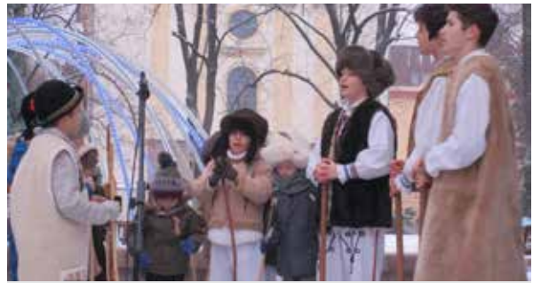
Vystúpenie počas prvej adventnej nedele.