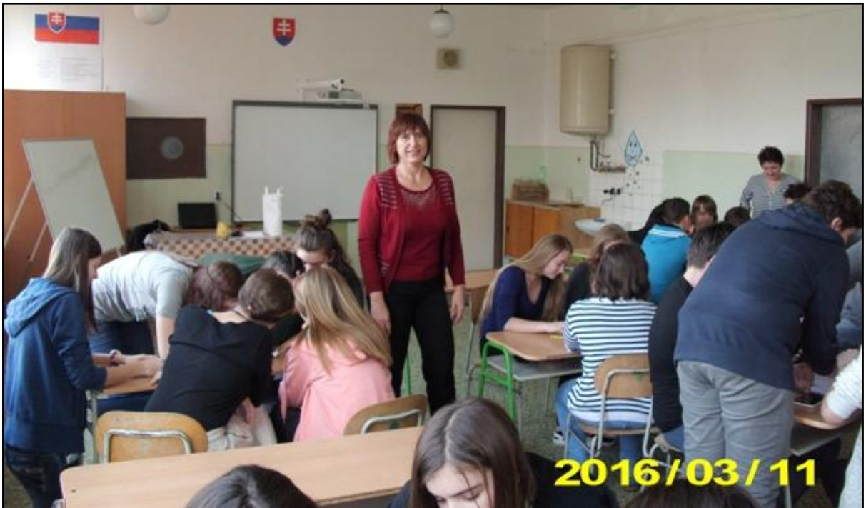
Vít'azná skupina – najvýstižnejší trojuholník horenia