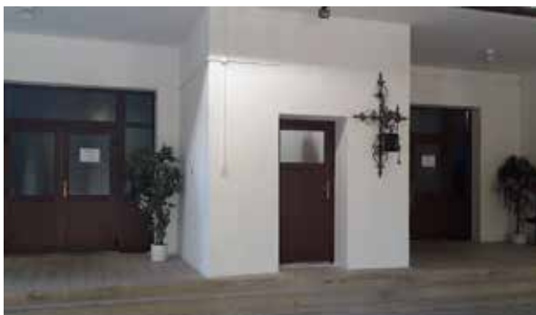
Vchod do Domu smútku.

Dom smútku na cintoríne v Zlatých Moravciach dostal nové dvere. O ich osadenie sa postarali Technické služby mesta, ktoré výmenu realizovali zo svojich vlastných finančných prostriedkov.