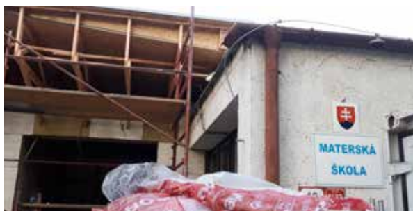
Prebiehajúca rekonštrukcia v MŠ Kalinčiakova.

V Materskej škole Kalinčiakova je v týchto dňoch rušno. Prebieha tu rozsiahla rekonštrukcia spojená s novou výstavbou, vďaka ktorej dôjde k rozšíreniu kapacity škôlky. Samospráva na tento účel získala nenávratný finančný príspevok vo výške viac ako 360-tisíc eur.